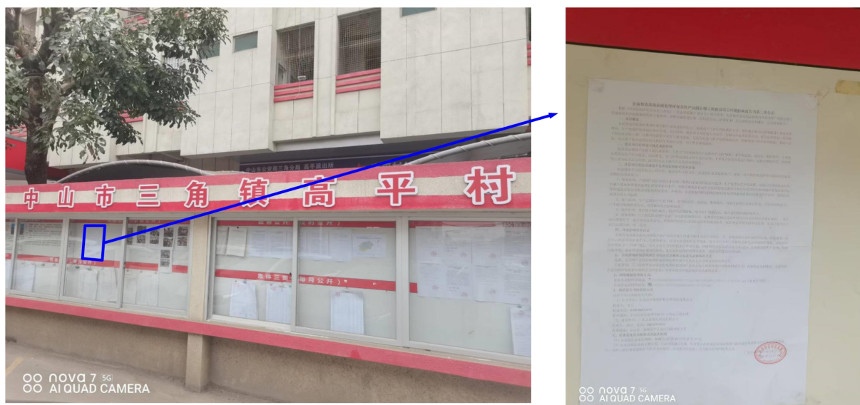
图 3-4 高平村征求意见稿公示现场照片

项目于2024年12月16日至2024年12月27日持续10个工作日在高平村以及厂区门口张贴项目环评征求意见稿公示信息，公示张贴照片具体见下图。