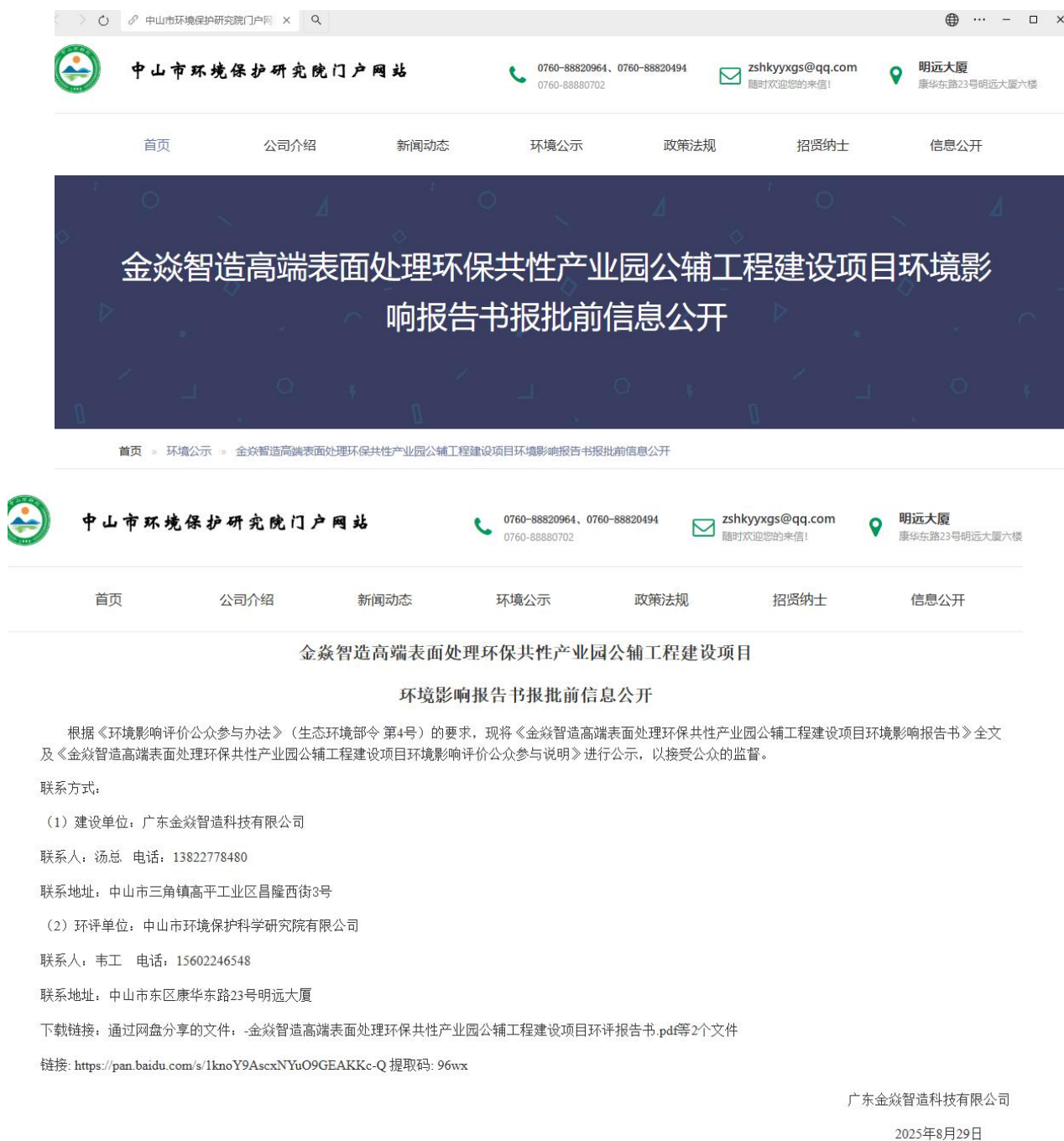
图 6-1 项目报批前信息公开