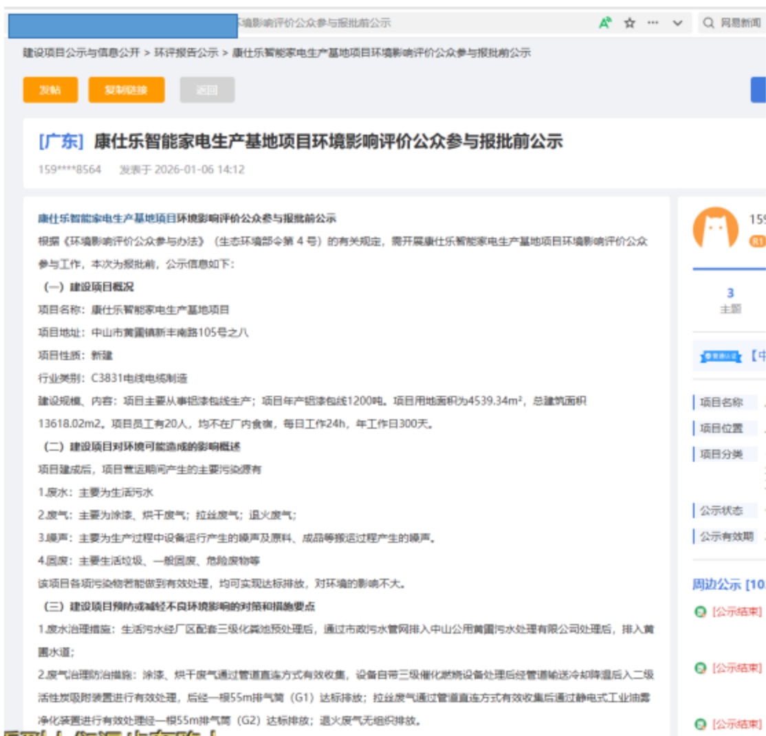
图 6.2-1 报批稿公示信息截图