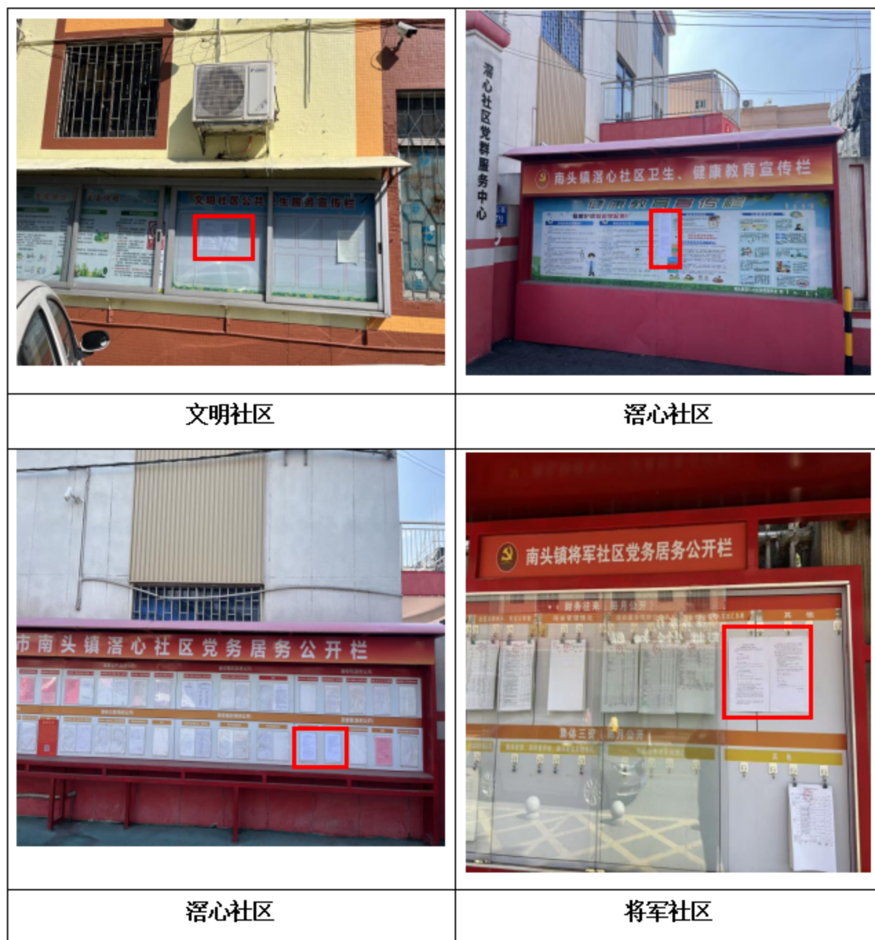
图 3.2-4 征求意见稿公示信息现场张贴照片