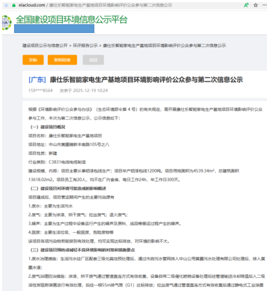
图 3.2-1 征求意见稿公示网上截图