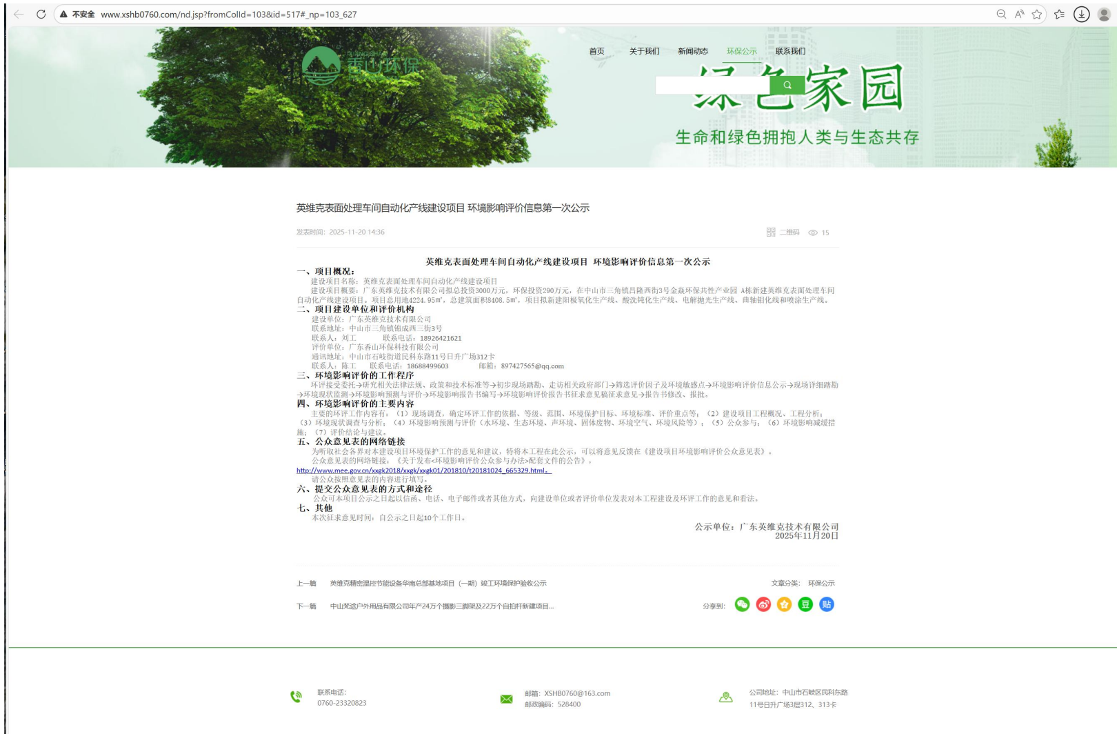
图 4.1 首次环境影响评价信息公开网上公示截图