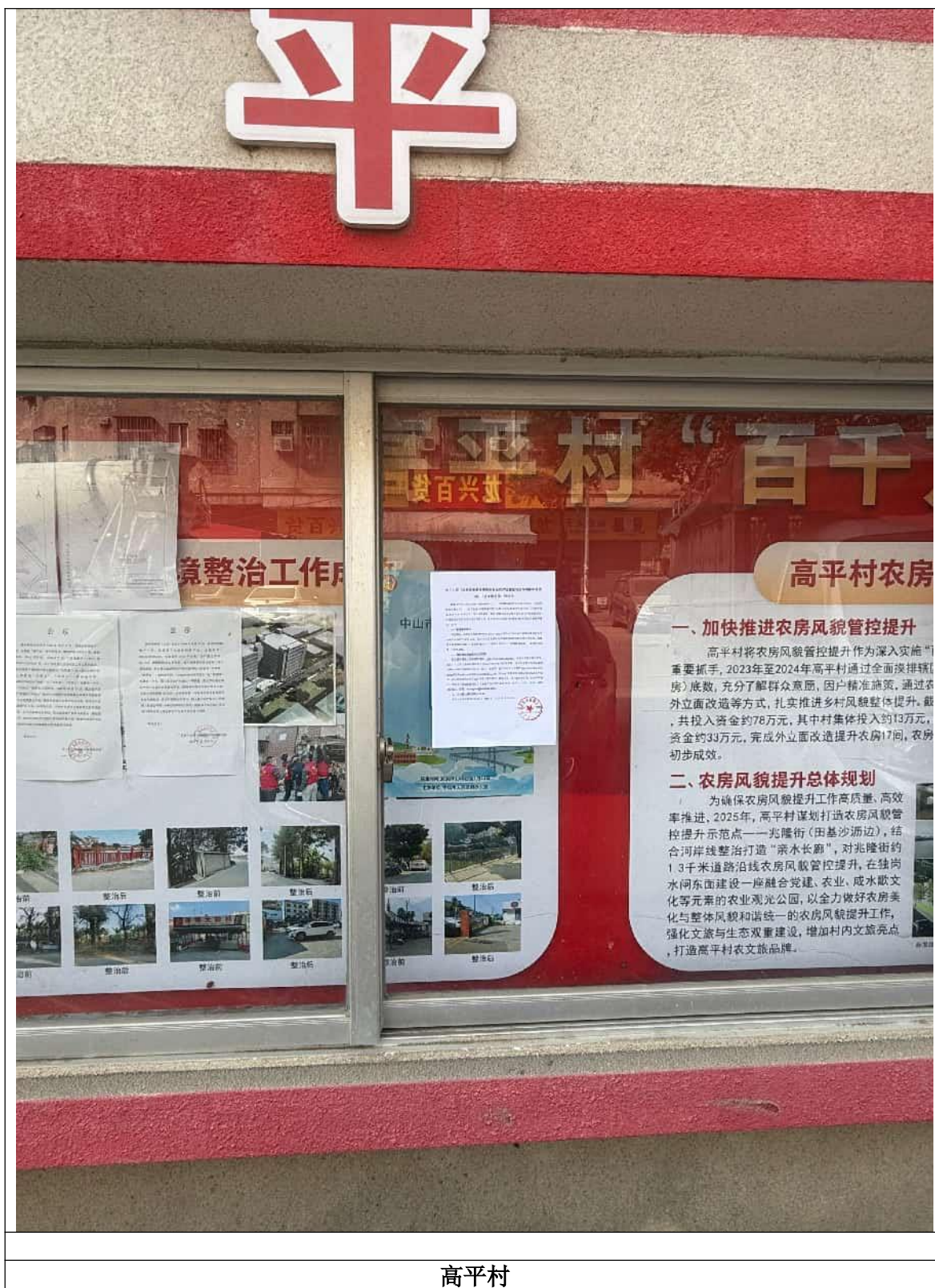
高平村 图 5.4 现场公示照片