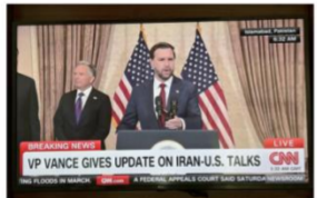
这是4月12日在巴基斯坦首都伊斯兰堡拍摄的美伊代表团召开新闻发布会的电视画面。

据多家媒体和知情人士透露,美国与伊朗11日在巴基斯坦谈判,从下午谈到12日凌晨,其间双方以不同形式举行三轮谈判,在“面对面”环节谈了两小时,过程中双方“情绪起伏很大”。 伊朗政府12日在社交媒体上说,谈判告一段落,双方技术专家将交换文本。伊朗政府说:“尽管双方仍有分歧,但将继续谈判。”伊朗媒体先称谈判延长一天,后来又宣告谈判结束,“美国的过分要求阻碍了共同框架和协议的达成”。