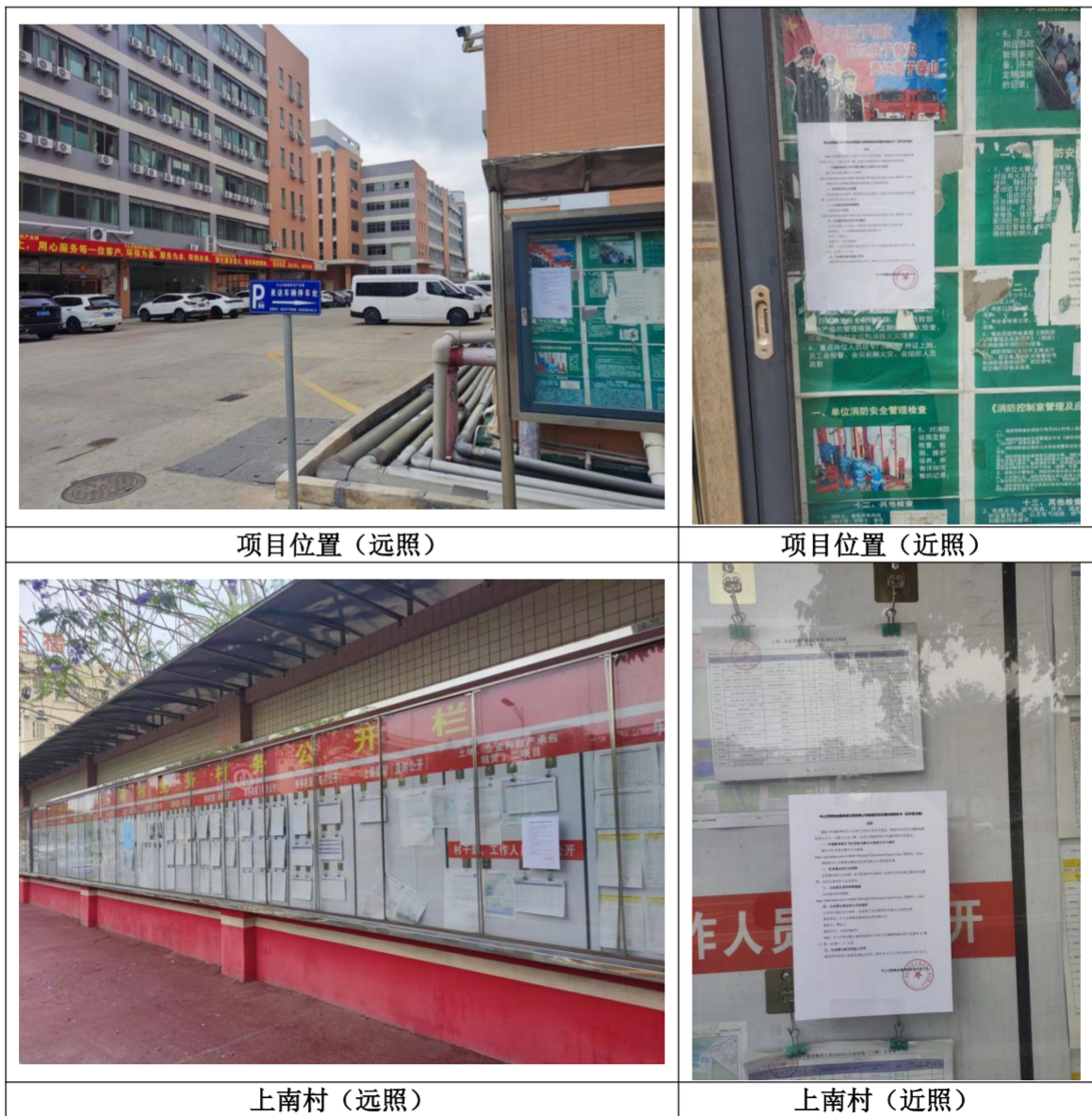
图 3.2-4 征求意见稿现场张贴照片

建设单位于2026年4月2日在项目位置、上南村等地的公告栏张贴公告进行征求意见稿公示，公示时限为2026年4月2日至2026年4月16日（共10个工作日）。本项目张贴公告现场照片详见下图。