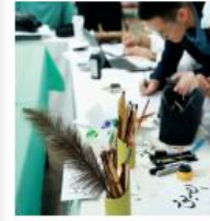
6月9日,在科威特哈利法王子会议中心举行文明对话国际日庆祝活动。