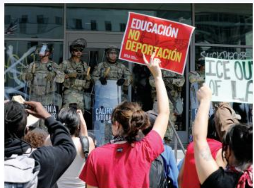
6月9日,在美国加利福尼亚州洛杉矶,示威者与国民警卫队人员对峙。

洛杉矶之乱的导火索是移民问题。连日来,美国联邦执法机构在洛杉矶多地展开针对非法移民的大规模行动,引发当地民众抗议。美国联邦移民及海关执法局移民执法队人员进入洛杉矶地区,被认为是1968年以来美国总统首次在东海岸城市地区发动大规模移民执法行动。8日,国民警卫队和洛杉矶警方与抗议民众发生激烈冲突。9日,美军北方司令部确认约700名非法移民在洛杉矶地区被捕。美国民主党州长加利福尼亚州州长纽森在社交媒体上表示,国民警卫队进入洛杉矶地区是“对民主的严重打击”,并呼吁加州州长纽森在8日发表联合声明,谴责特朗普政府“滥用执法权”,并呼吁加州州长纽森在8日发表联合声明,谴责特朗普政府“滥用执法权”,并呼吁加州州长纽森在8日发表联合声明,谴责特朗普政府“滥用执法权”。