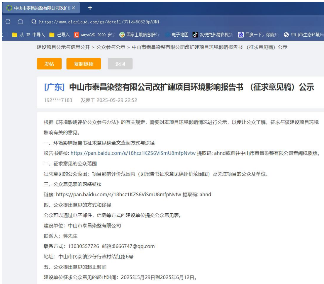
图 3.2-1 网络公示截图