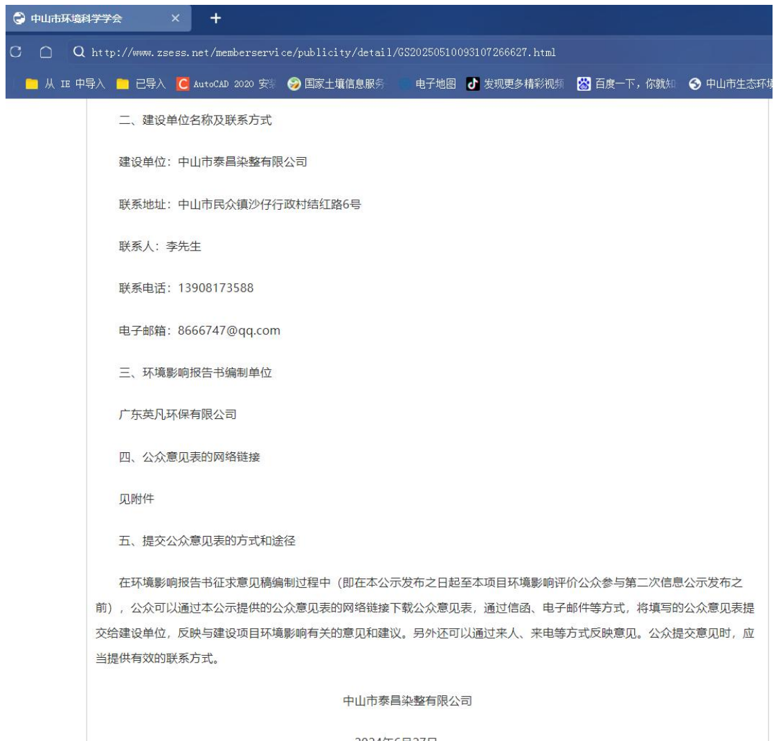
图 2.2-1 首次环境影响评价信息公开截图