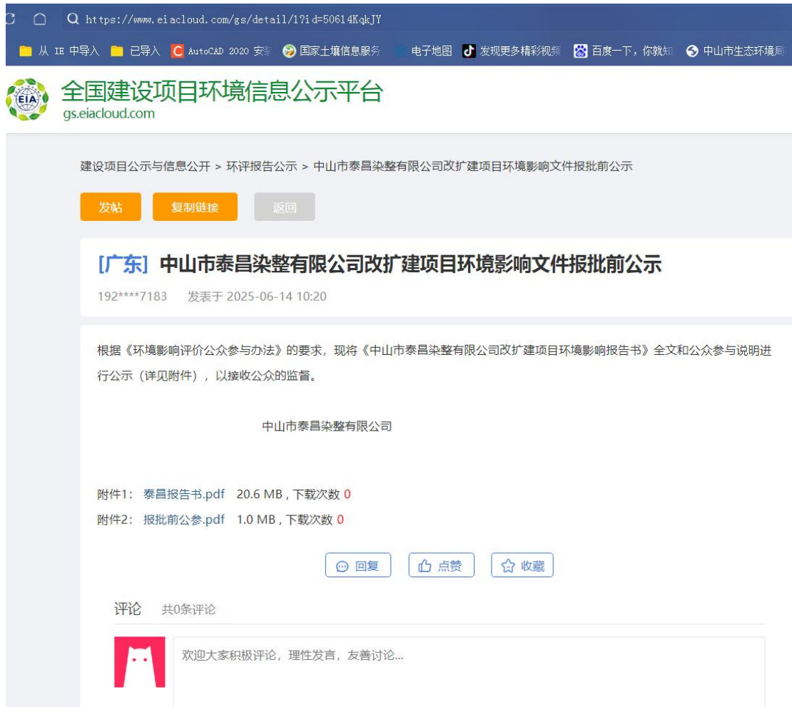
图 6.2-1 项目报批前网络公示截图